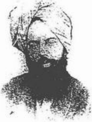
Mirza Gulam Ahmet Kadiyani İmam Mehdi ve Va'dolunan Mesih

Yüce Peygamber Efendimizin hadisine göre, güneşle ay Ramazan ayında tutularak, Mehdi'nin doğruluğuna şahadet etmiştir.